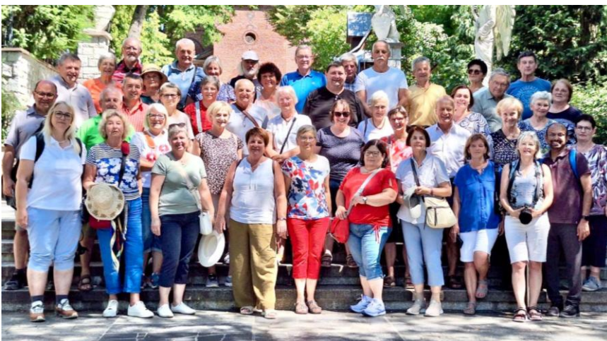
Die Reisegruppe erlebte eine unvergessliche Reise, reich an kulturellen Höhepunkten und spirituellen Erfahrungen.

rührte Natur der Masuren. Warschau zeigte sich mit seiner beeindruckenden Wiederaufbauleistung. Ein tiefer spiritueller Moment war der Besuch der Wallfahrtskirche in Tschenschow, wo Pfarrer Wilson mit seiner Gruppe eine Hl. Sonntagsmesse vor dem Gnadenbild der Schwarzen Madonna feierte. Den Abschluss bildete Krakau mit dem beeindruckenden Salzbergwerk Wieliczka und seiner Kapelle.