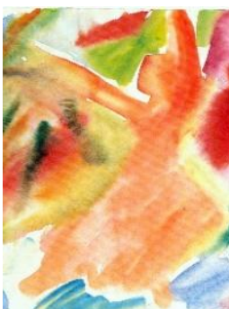
„Tanzende Rut“ Maria Hafner