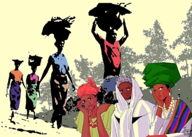
Titelbild: Gift Amarachi Ottah / Weltgebetstag der Frauen